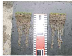
【茨城県Dゴルフクラブ】 実施時期4月~6月(3ヵ月後) 投下量 1.5cc(月)