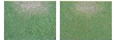
(写真左) 腐植元KELP処理区 (写真右) 通常処理区

表面の状態はテスト区のほうが良くなっており、密度、葉幅の揃い方も上回る結果となっています。 また、茎の状態を見ると、対象区では寝ている茎が多いのに対してテスト区では立っている茎が多いことが見受けられます。 根の状態も根量でテスト区は対象区を上回る結果が出ました。